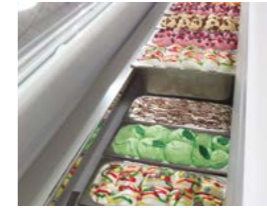
Display - piled up double row - 5 Lt Vasca espositiva - doppia fila di riserva - 5 Lt